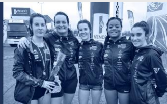
Un club plein d'avenir