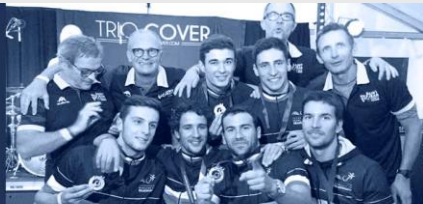
Champion de France 2018